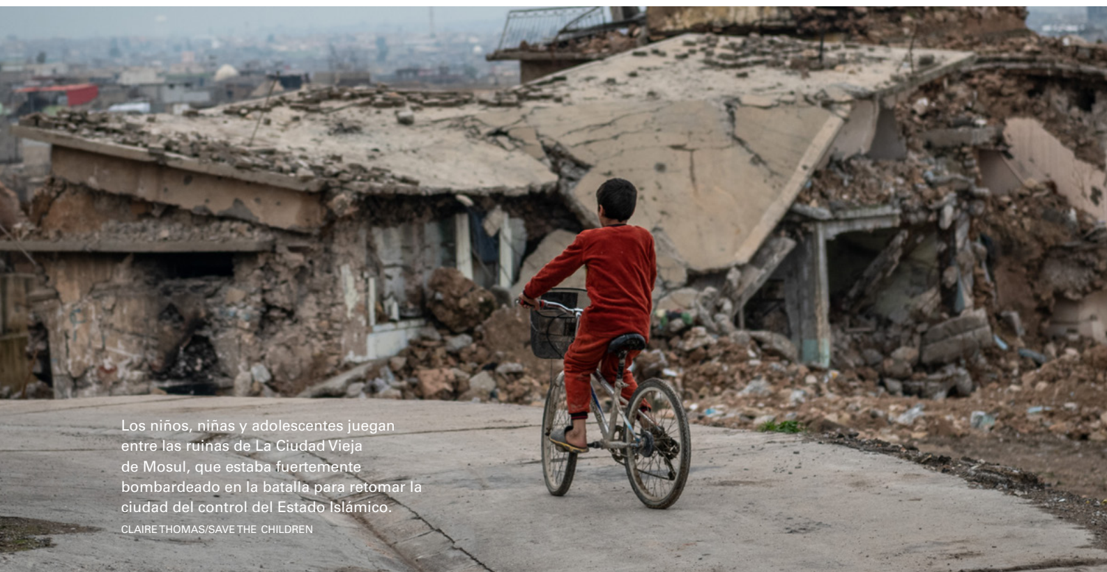
Los niños, niñas y adolescentes juegan entre las ruínas de La Ciudad Vieja de Mosul, que estaba fuertemente bombardeado en la batalla para retomar la ciudad del control del Estado Islámico.