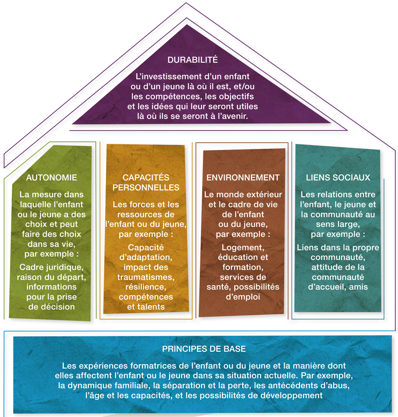
Figure 1 : Modèle conceptuel de l'intégration