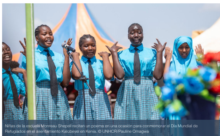
Niñas de la escuela Monreau Shepell recitan un poema en una ocasión para conmemorar el Día Mundial de Refugiados en el asentamiento Kalobeyei en Kenia.

niñez y la adolescencia en el contexto de los planes de respuesta humanitarios sigue teniendo una financiación desproporcionadamente insuficiente: un 29,2 % de media, en comparación con el 46,9 % de los planes de respuesta humanitarios en general. En los contextos de refugio, el alcance de la financiación para la protección de la niñez y la adolescencia fue del 30,8 %, lo que se aproxima a la tasa general de financiación de la respuesta para las personas refugiadas, que es del 31,5 %.