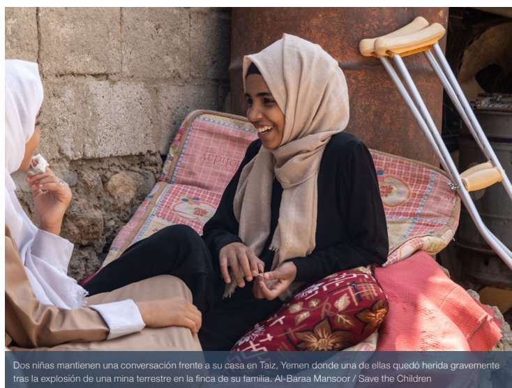
Dos niñas mantienen una conversación frente a su casa en Taiz, Yemen donde una de ellas quedó herida gravemente tras la explosión de una mina terrestre en la finca de su familia.

En 2023, se registró un total de 505 millones de dólares de financiación para la protección de la niñez y la adolescencia, que incluyó los 412 millones de dólares de los llamamientos coordinados por las Naciones Unidas. Las mejoras en la presentación de informes al Servicio de Seguimiento Financiero y en la Herramienta de Seguimiento de la Financiación a Refugiados han mejorado la visibilidad de la financiación de la protección de la niñez y la adolescencia. Pese a haberse registrado un cierto aumento, la protección de la