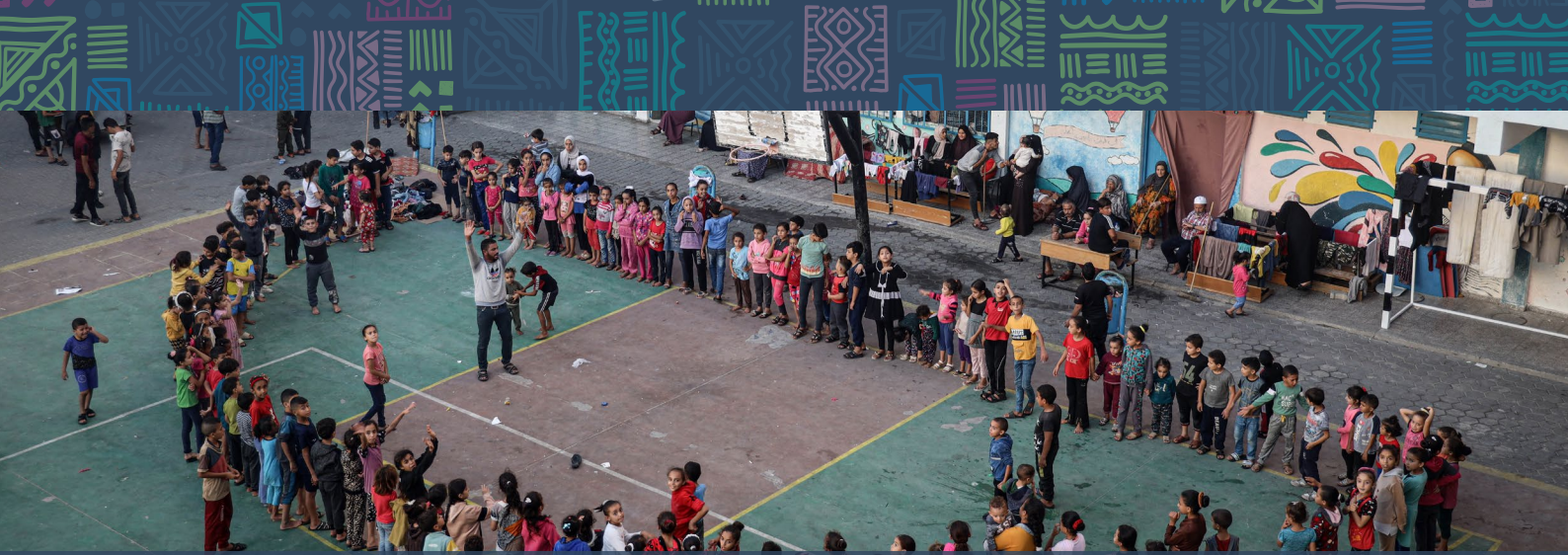
Niños juegan durante sesiones de actividades recreativas apoyadas por UNICEF en los refugios en Rafah, ciudad al sur de la Franja de Gaza, mientras continúan las hostilidades.