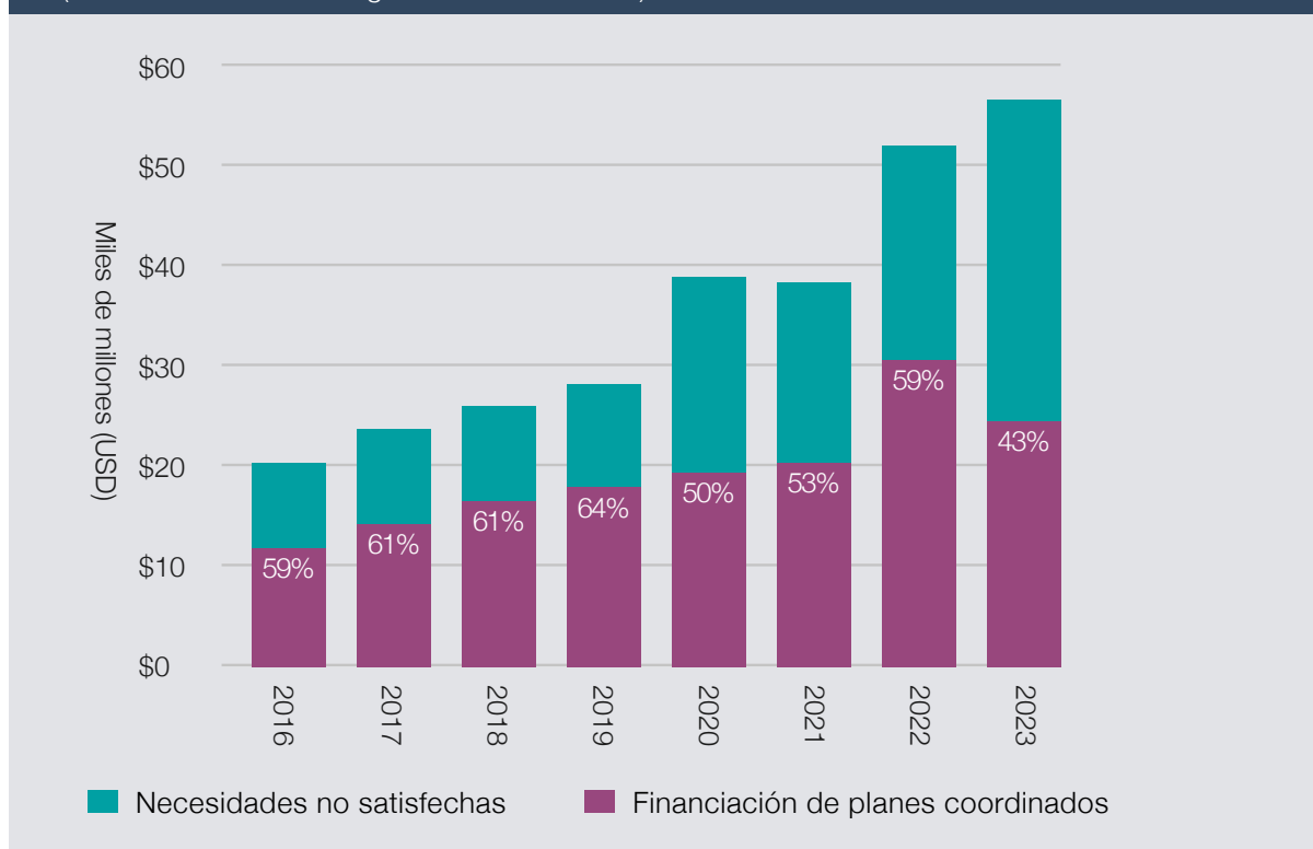
Figura 1 - Alcance histórico de los planes coordinados por las Naciones Unidas

En 2023, las necesidades humanitarias alcanzaron niveles nunca vistos, debido al aumento de los conflictos armados, a desplazamientos forzados sin precedentes, a la emergencia climática y a las catástrofes derivadas de peligros naturales. A finales del 2023, 363 millones de personas precisaron asistencia humanitaria. De ellas, 245 millones fueron destinatarias de planes de respuesta coordinados por las Naciones Unidas: un aumento del 7 % con respecto a los datos preliminares del Panorama Global Humanitario de 2023. Estas crisis crecientes hicieron que las necesidades de financiación humanitaria aumentaran hasta 56 700 millones de dólares a finales de 2023. Pese a que los niveles de financiación fueron de los más altos de la historia, la tasa de financiación para los llamamientos coordinados por las Naciones Unidas fue solo del 43 %, la más baja de la historia. Los menores serán los más perjudicados por este déficit de financiación, ya que se ven afectados de manera desproporcionada por las crisis humanitarias.