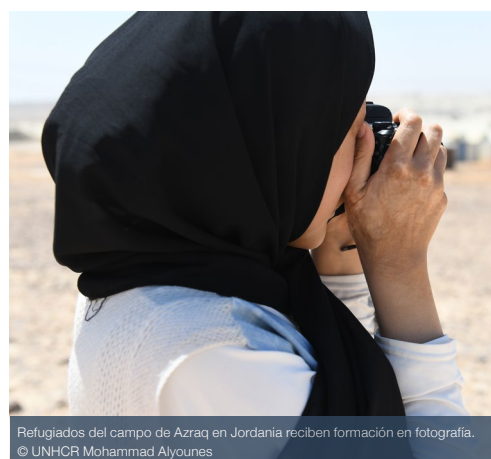
Refugiados del campo de Azraq en Jordania reciben formación en fotografía.

Los organismos de las Naciones Unidas y las ONG internacionales siguieron recibiendo la gran mayoría de la financiación humanitaria para la protección de la niñez y la adolescencia. Solo el 2 % de la financiación de la protección de la niñez y la adolescencia registrada en el Servicio de Seguimiento Financiero fue directamente a organizaciones locales. Si bien el aumento de la financiación directa y de calidad es fundamental para fortalecer las funciones y las capacidades de los profesionales locales y nacionales en protección de la niñez y la adolescencia, las limitaciones de los mecanismos actuales de presentación de informes dificultan el seguimiento preciso de la situación.