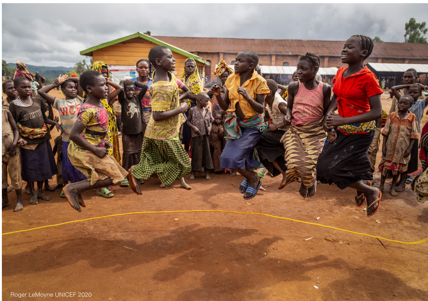
Roger LeMoyne UNICEF 2020

Reservar tiempo para preguntas y pedir a los participantes a que se presenten.